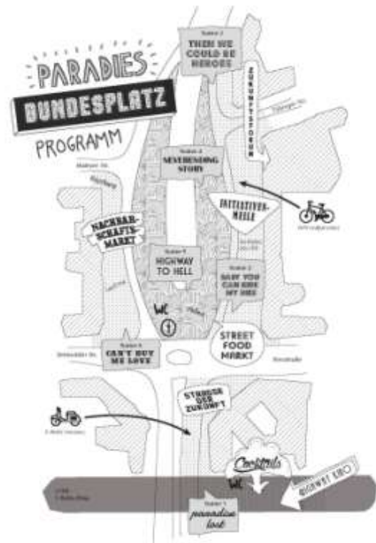
Abbildung 4: Programmplan Paradies Bundesplatz.

Die Initiative Bundesplatz hatte seit Beginn wissenschaftliche Partner*innen, von denen einige heute als Fachbeirat fungieren. Schon 2010 startete sie ein „Charrette-Verfahren“ für den Bundesplatz. Im Jahr 2013 wurde dann – von der Initiative initiiert und durch Senat und Bezirk gefördert – eine Zukunftswerkstatt Bundesplatz durchgeführt. Mit Unterstützung von Wissenschaftler*innen haben die Teilnehmenden ein städtebauliches Umnutzungskonzept entworfen, das nicht nur inhaltlich für die Berliner Stadtentwicklung auf der Suche nach neuen Mobilitätskonzepten, sondern auch für frühzeitige Bürgerbeteiligung bei städtebaulichen und verkehrlichen Planungsverfahren zukunftsweisend sein kann. Unter dem Titel „Paradies Bundesplatz 2030+“ nahm die Initiative Bundesplatz 2015 am Wettbewerb Zukunftsstadt teil (vgl. Bezirksamt Charlottenburg-Wilmersdorf 2016). Grundlage des Wettbewerbskonzepts waren die Ergebnisse der Zukunftswerkstatt.