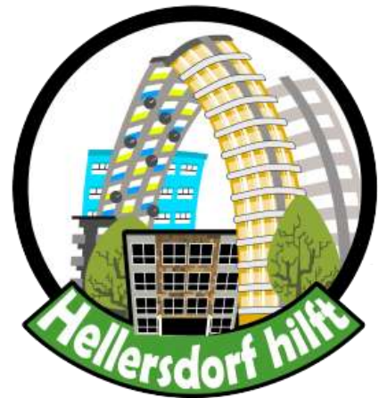
Abbildung 6: Logo der Willkommensinitiative Hellersdorf hilft (Quelle: https://hellersdorfhilft.files.wordpress.com/2015/09/hehi.png?w=283 ).

Die Initiative „Hellersdorf hilft“ war nicht nur eine der ersten Willkommensinitiativen dieser Form in Berlin, sondern auch namengebendes Vorbild für viele weitere im restlichen Stadtgebiet. Sie entstand 2013 aus einer aufgeladenen Situation im Bezirk Marzahn-Hellersdorf, die medial vor allem durch rassistische Anwohnerproteste gegen eine entstehende Flüchtlingsunterkunft in der Carola-Neher-Straße dominiert wurde. Zu einer bezirklichen Informationsveranstaltung für Anwohnende im Sommer des Jahres erschienen fast 1.000 Menschen, obwohl das Bezirksamt nur etwa 100 Teilnehmende erwartete. Unter den Anwesenden befanden sich etwa 200 angereiste Neonazis; statt geordneter Kommunikation vermittelte diese Veranstaltung ein lokales Klima der Ablehnung. Als Reaktion gründeten einige bei der Info-Veranstaltung anwesende Anwohner*innen eine Facebook-Gruppe zunächst nur zum Austausch Gleichgesinnter. Da die Seite über Nacht 15.000 Likes bekam, entwickelten sie aktives Engagement – zunächst mit Aufklärungskampagnen und nach der Ankunft der Geflüchteten allerlei Unterstützungsaktivitäten, wodurch die Initiative „Hellersdorf hilft“ schnell expandierte und sich im Jahr 2014 in Form eines Vereins institutionalisierte.