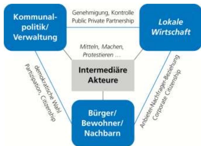
Abbildung 1: Intermediäre im Kräftedreieck von Kommunalpolitik/-verwaltung, lokaler Wirtschaft und Bürgerschaft (Quelle: Beck/Schnur 2016: S. 23).

Diskurs an, der darauf abzielt, Erscheinungs- und Aktionsformen vielfältiger Mitgestalter zwischen den lokalen Institutionen der repräsentativen Demokratie und Zivilgesellschaft in einer vielfältigen Demokratie zu verorten. Ein besonderes Merkmal dieser Mitgestalter, so die These der Autoren, sind veränderte Kommunikationsformen und eine weitaus größere Kommunikationsdichte als je zuvor. Dies führt zu der Frage, „inwieweit das Auftreten bottom-up- oder horizontal orientierter