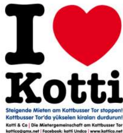
Abbildung 3: Logo und Sticker der Mietergemeinschaft Kotti & Co.