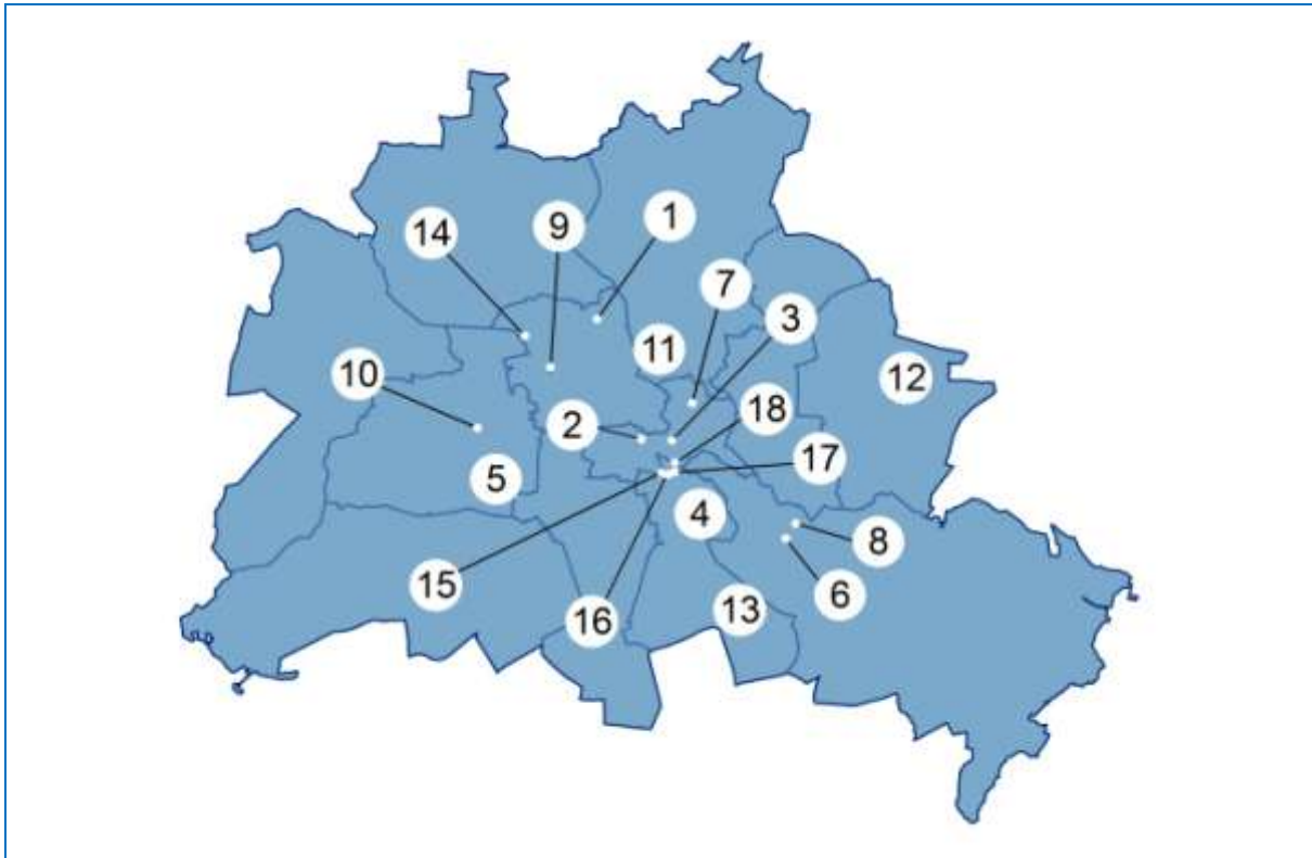
Abbildung 2: Auswahl neuer intermediärer Akteure in Berlin, die in dieser Studie näher untersucht wurden und die sich lokal verorten lassen.