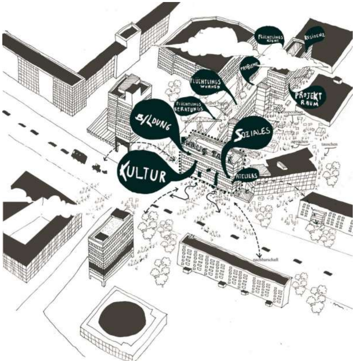
Abbildung 5: Konzeptvisualisierung zum Haus der Statistik (Quelle: Initiative Haus der Statistik 2017).