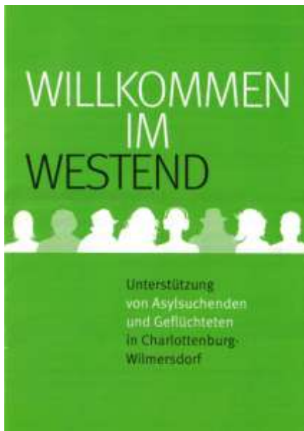
Abbildung 7: Flyer der Initiative (Quelle: Willkommen im Westend).